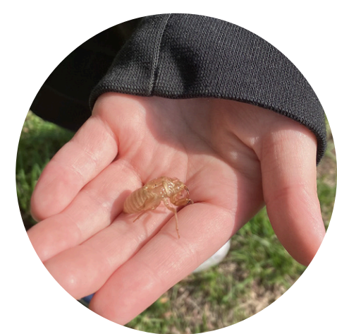
【もりぴたで見つけたよ】 抜け殻を見つけると、子どもも大人もテンションがあがります。この日はたくさんの抜け殻を見つけました。この夏はセミがたくさん鳴くのかな。

去年の池を片付けて、2026年バージョンの池が完成しました！子どもたちとスコップで穴を掘り、石を並べて芝生を引き、水を張りました。水が入るとみんな大喜び！今シーズンも新しい池でたくさん遊びます。